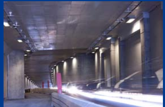
Brandinklädnad av vägtunneln vid Fridhemsplan.